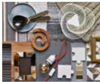
Kolory i wzory z wnętrza – s. 45