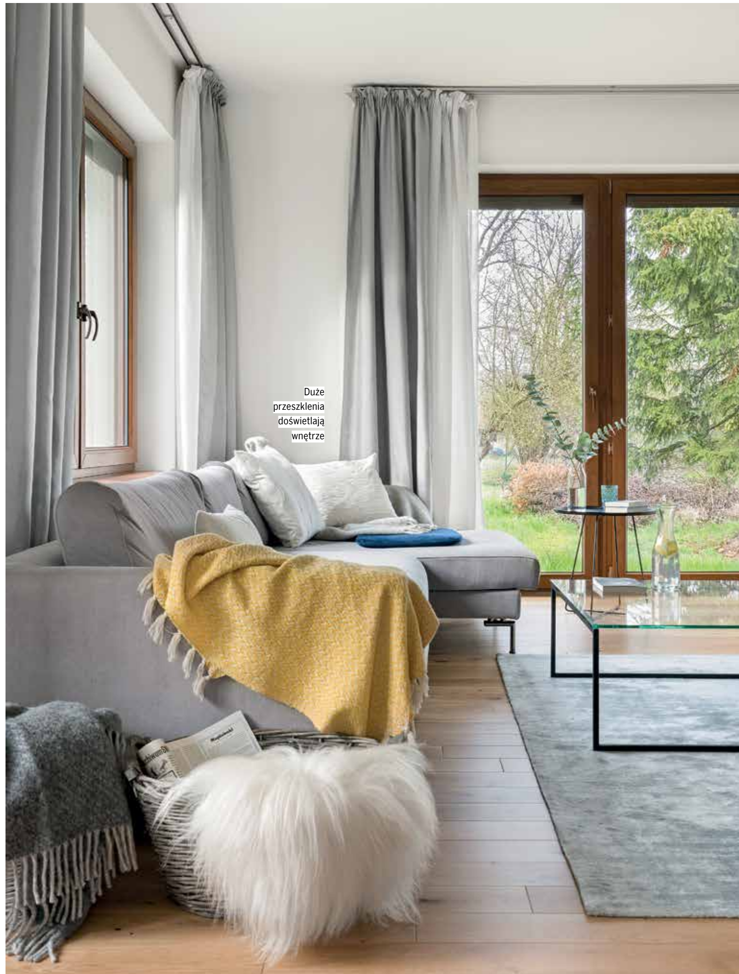
Duże przeszklenia doświetlają wnętrze