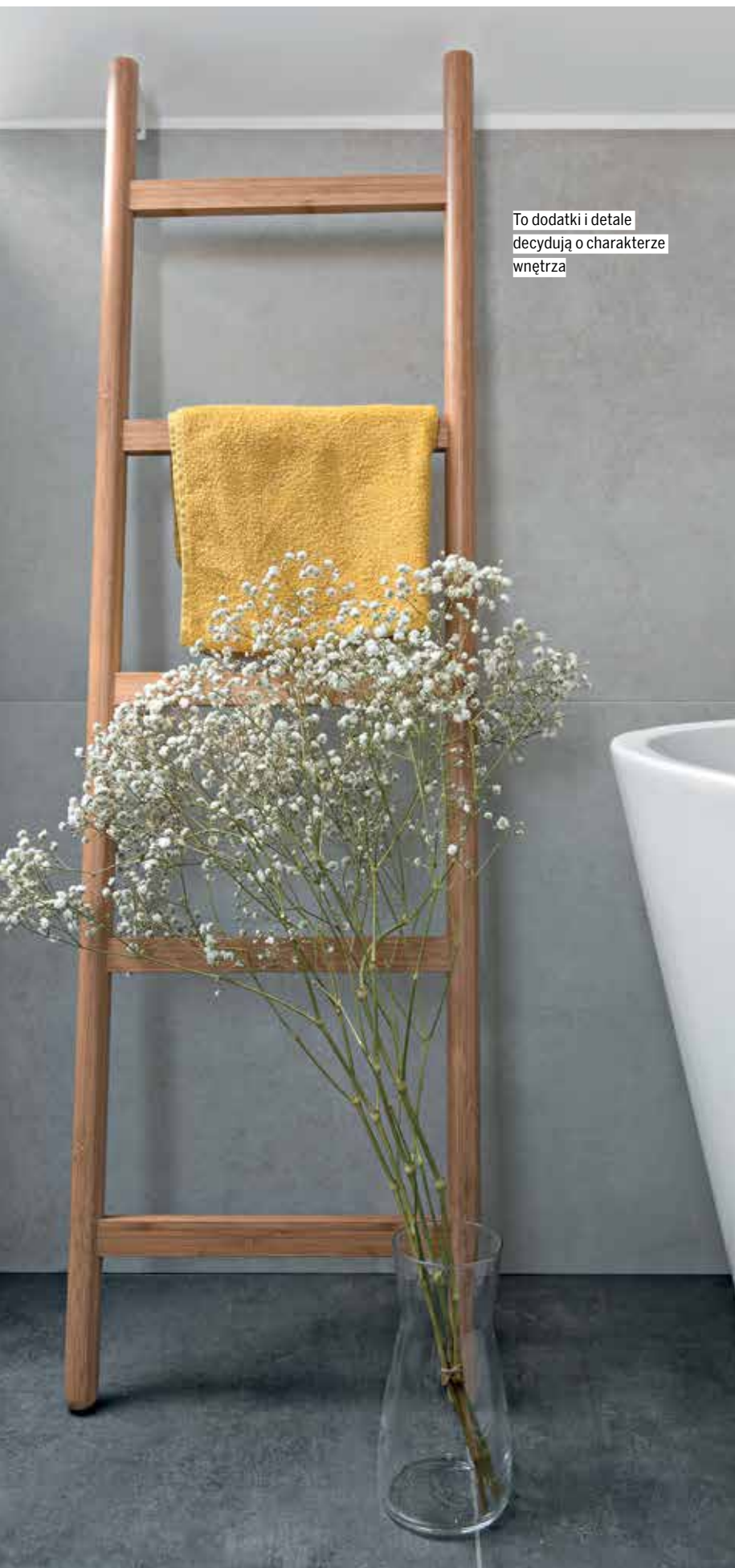
To dodatki i detale decydują o charakterze wnętrza