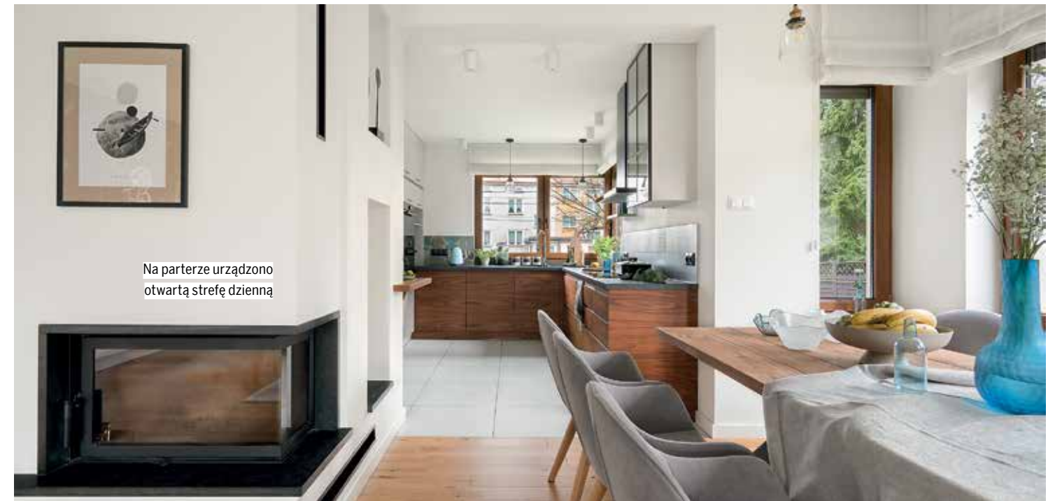
Na parterze urządzono otwartą strefę dzienną