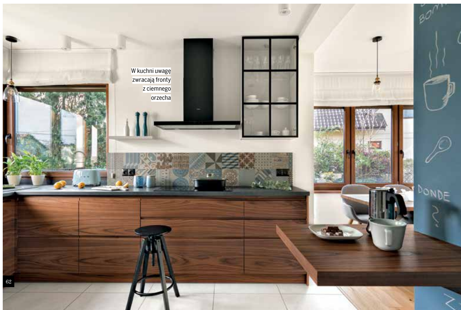
W kuchni uwagę zwracają fronty z ciemnego orzecha