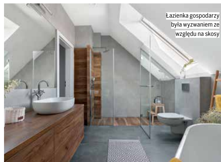
Łazienka gospodarzy była wyzwaniem ze względu na skosy