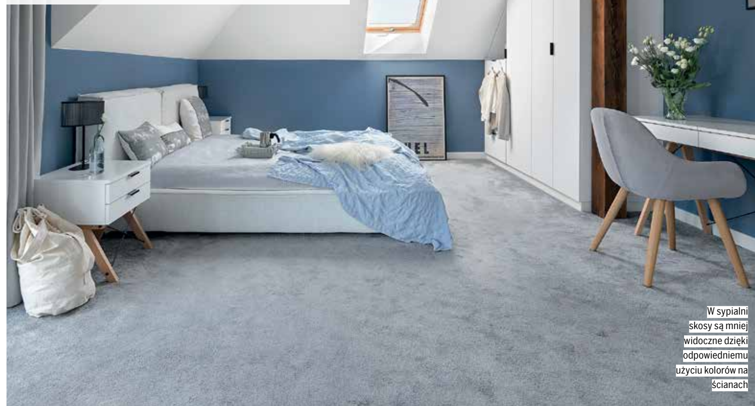
W sypialni skosy są mniej widoczne dzięki odpowiedniemu użyciu kolorów na ścianach