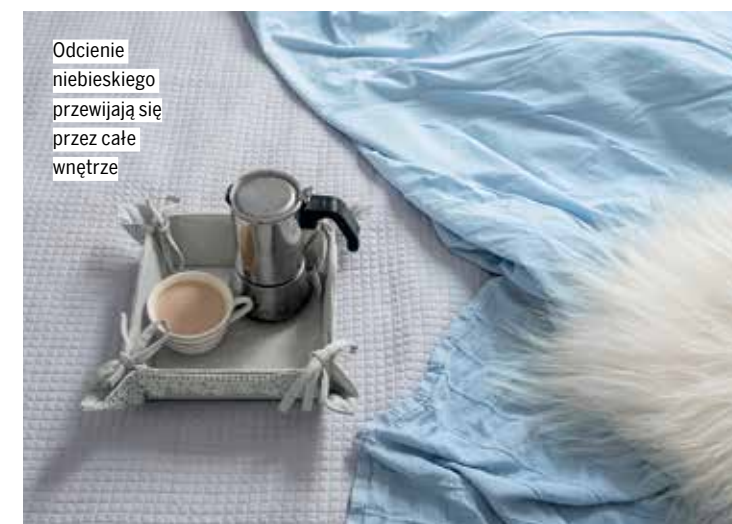
Odcień niebieskiego przewijają się przez całe wnętrze